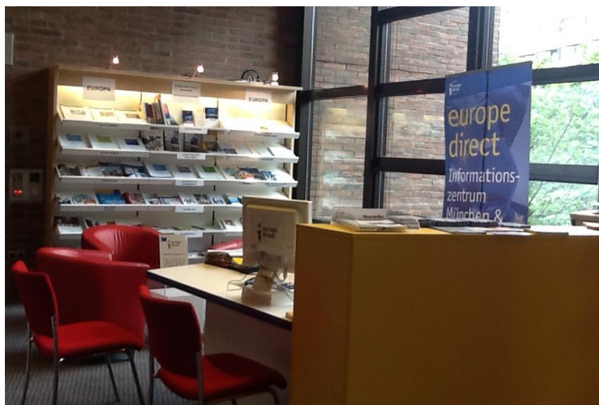
МАЛ. 1. ІНФОРМАЦІЙНИЙ ЦЕНТР EUROPE DIRECT У ПУБЛІЧНІЙ БІБЛІОТЕЦІ М. МЮНХЕН

Департаменту праці та економічного розвитку й Департаменту мистецтв і культури міста, який представляє міська бібліотека. Публічна бібліотека м. Мюнхен має ЦЄІ Мюнхена і Верхньої Баварії. Це – та перша точка доступу, куди звертаються громадяни, установи і школи з питань, що стосуються ЄС.